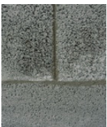
De 1 à 3 mm Encollage à l'Alkercol

La solution à privilégier dépend de la taille de l'espace vide à combler.