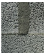
De 3 mm à 5 cm Remplissage au mortier