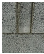
Plus de 5 cm Coupe encollée