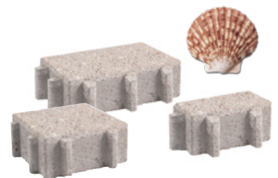
HYDROJOINT OCEAN 30

Son secret réside dans son aspect de surface qui est constituée en partie par des déchets de coquilles Saint-Jacques broyées.